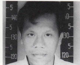
pasar timur, Denpasar. Judul karya: Bayi Misteri , 1992.