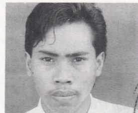
1973. Masih kuliah di STSI Denpasar. Alamat: Br. Wangngbung, Suka-wati, Bali. Judul karya: Topeng Kehidupan , dan Pertarungan Hidup Mati , 1993.